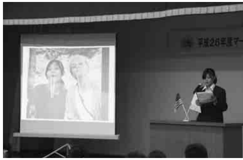
思い出の写真とともに体験談を発表しました

平成26年12月14日(日)に中央公民館にて国際姉妹都市マールボロウ市との教育交流事業(中学生海外派遣事業およびマールボロウ市友好訪問団受入事業)の報告会を開催しました。