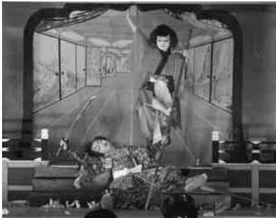
秋川歌舞伎 「絵本太功記二段目 本能寺の場」

平成27年3月15日 編集・発行／あきる野市教育委員会 〒197-0814 あきる野市二宮350 ☎042(558)1111(代)