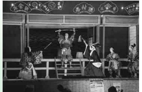
菅生歌舞伎 「絵本太功記十段目 尼ヶ崎閑居の場」