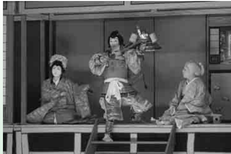
菅生歌舞伎 「絵本太功記十段目 尼ヶ崎閑居の場」