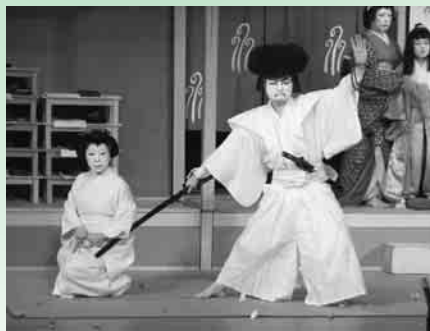
秋川歌舞伎 「菅原伝授手習鑑 寺子屋の場」